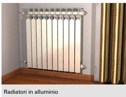
Radiatori in alluminio