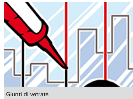
Giunti di vetrate