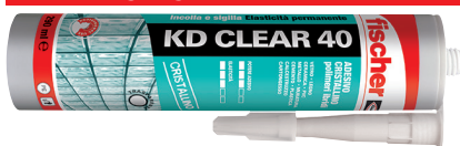
Adesivo sigillante KD CLEAR 40