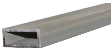
Profilo REP AL