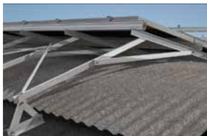
Struttura speciale su copertura industriale