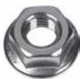
Dado flangiato MU F A2