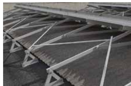
Dettaglio: vista posteriore struttura