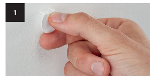
1 In die Wand drücken.