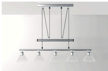
Luminárias de teto