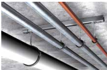
Tubazioni leggere sospese