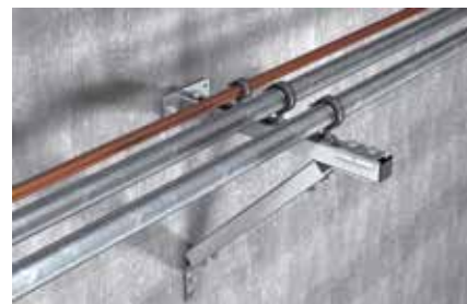
Installazione leggera su mensola