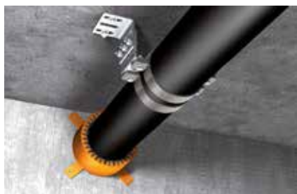
Collare punto fisso per tubazioni