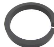
Riduzione 110-90 per sanitari sospesi