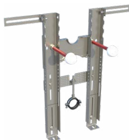
Configurazione PREMIUM per bidet