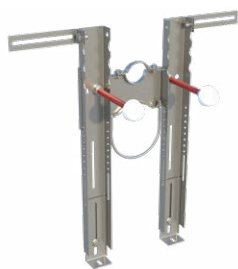
Configurazione PREMIUM per WC