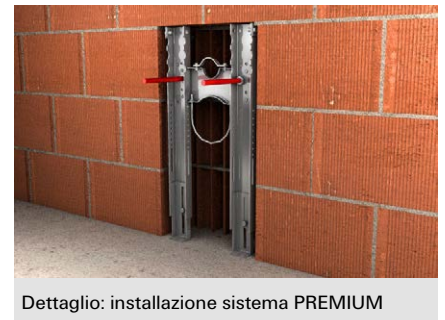
Dettaglio: installazione sistema PREMIUM