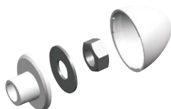
BUAK per sanitari sospesi