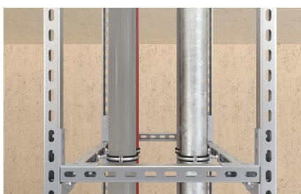
Struttura a telaio 3D.