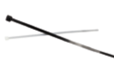
BN e UBN