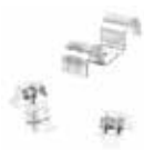
BSM, BSMD e BSMZ