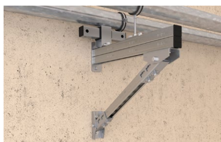
Installazione su mensola.