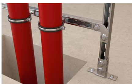
Montaggio di tubazione acque di scarico.