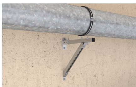
Condotta d'aria circolare su mensola.