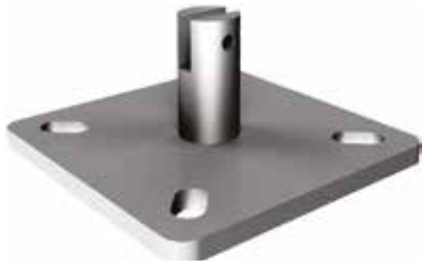
Piastra intermedia SVI