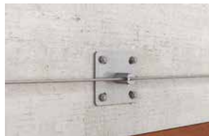
Linea flessibile verticale su parete