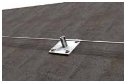
Linea flessibile verticale su copertura shed