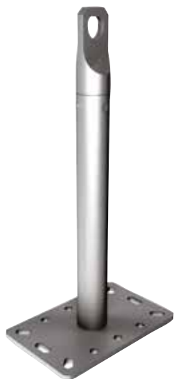
Palo girevole PG