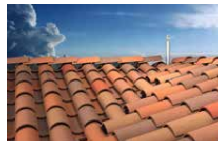
Palo girevole incrocio falde