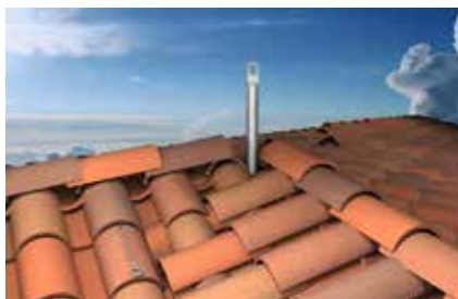
Palo girevole tetto a padiglione