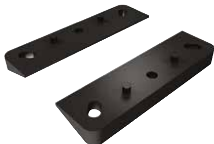
Supporto sagomato MULTIBASE MB