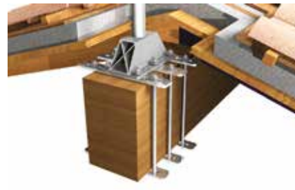
Palo di estremità con cerchiaggio su trave