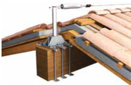
Palo di estremità con cerchiaggio su trave