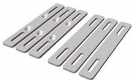
Kit cerchiaggio palo in alluminio CPA