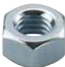
Dado esagonale MU