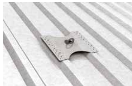
Dettaglio: fissaggio del punto di ancoraggio PGC A