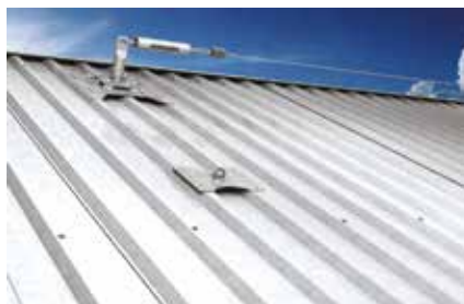
Sistema di ancoraggio su lamiera metallica