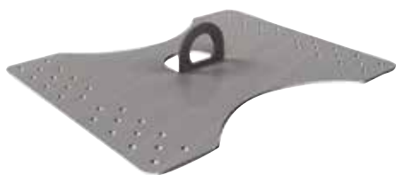
Piastra per lamiera metallica PGC 200-250 A