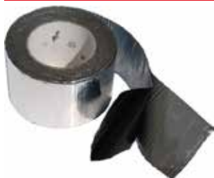
Nastro adesivo butilico CG INT