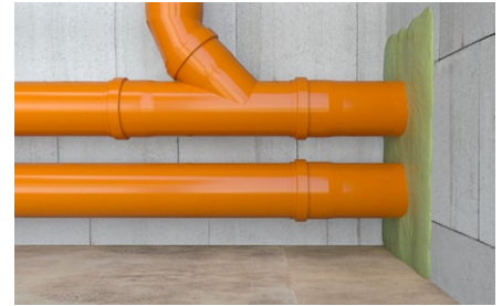
Chiusura di attraversamenti di tubazioni