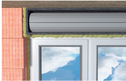
Riempimenti di giunti e cavità.