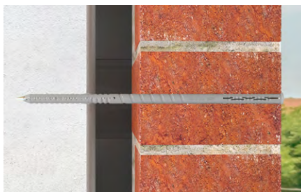
Risanamento murature faccia vista.