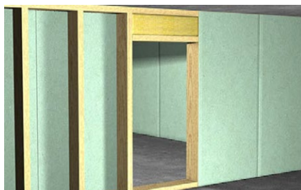
Completamento rapido delle finiture.