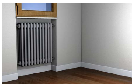
Installazione su supporti di spessore ridotto.