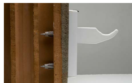
Espansione del tassello SX su materiale semipieno.