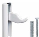
Mensola RX per radiatori in alluminio.