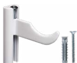
Mensola TX per radiatori tubolari a 2 e 3 colonne.