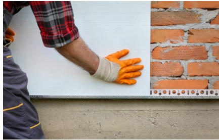
Incollaggio di lastre di cartongesso.