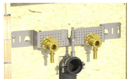
Applicazione in nicchia.