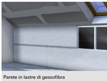
Parete in lastre di gessofibra