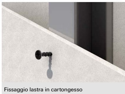
Fissaggio lastra in cartongesso