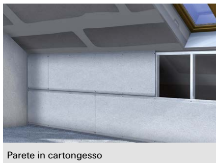
Parete in cartongesso