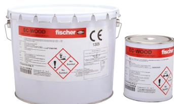
Malta epossidica EC-WOOD