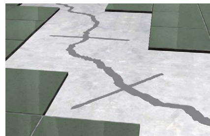
Sigillatura di fessure