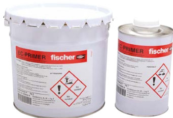
Primer epossidico EC-PRIMER