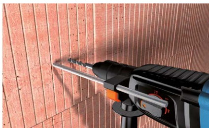
Fori su muratura