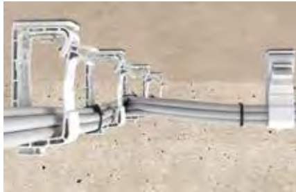
Bündelung von Elektrokabeln