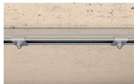
Installazione binario di montaggio a muro.