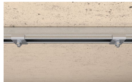
Installazione binario di montaggio a muro.