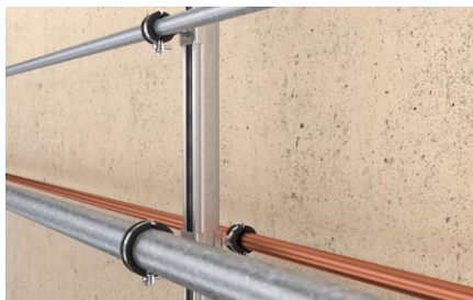
Installazione laterale tubazioni su binario di montaggio.