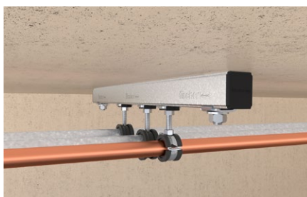
Fissaggio di tubazioni su canale a soffitto.