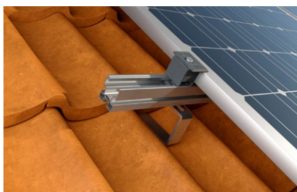
Copertura inclinata con rivestimento in tegole.