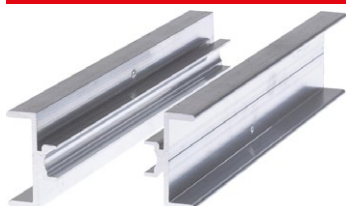
Collegamento CPN AL