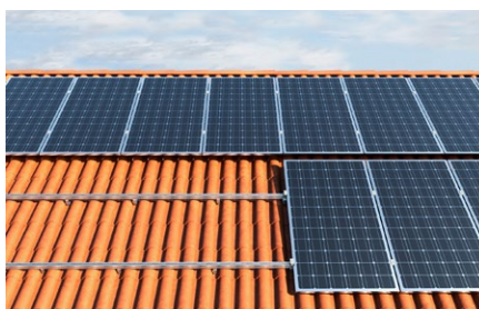
Copertura inclinata con rivestimento in coppi.