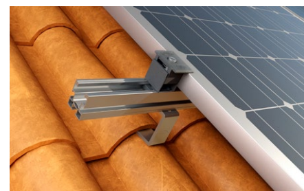
Copertura inclinata con rivestimento in coppi.