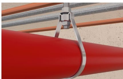
Installazione di un impianto sprinkler.