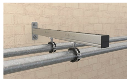
Fissaggio tubazioni su mensola.