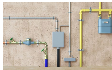
Fissaggio di tubazioni a parete e a soffitto.