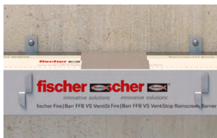
Sigillatura fra pannelli FFB-VS.