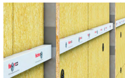
Sigillatura di giunti fra pannelli FCFcl.