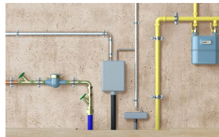
Fissaggio delle condotte.