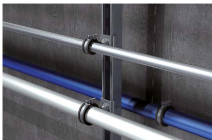
Installazione laterale tubazioni su binario di montaggio