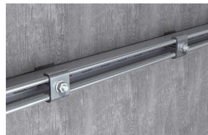
Installazione binario di montaggio a muro