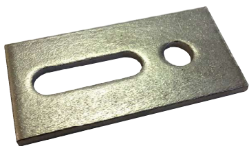
Úchyt nosníku SSP A2