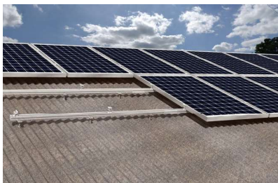
Instalace solárních panelů na šikmé střechy s vlnitou krytinou