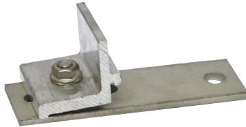
Předmontovaný úchyt nosníku plochý SSP SPEED A2