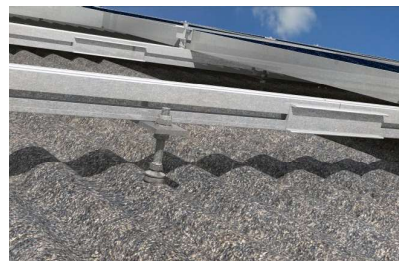
Detail upevnění úchytem SSP