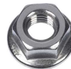
Nerezová matice s límcem MU F A2