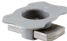
Rychloupínací matice FCN AL