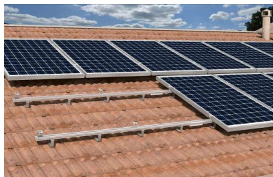
Šikmá střecha s pálenou taškou