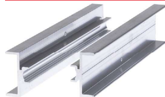
Spojka nosníků CPN AL