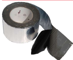
Butylová lepicí páska CG INT