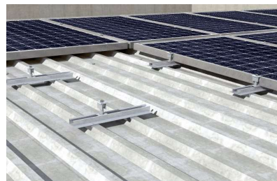
Princip využití segmentů nosníku Solar-flat