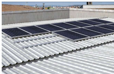
Montáž na trapézový plech