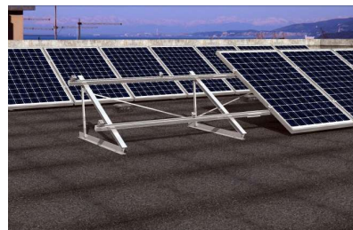
Montáž na rovnou střechu