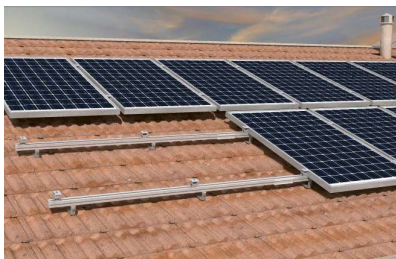
Montáž na šikmou střechu