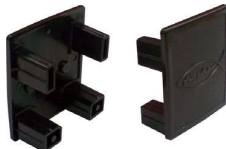
Krytka profilu Solar-fish AK SP