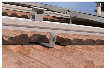
Detail upevnění s hákem GTRL