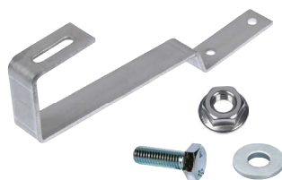
Pevný nerezový hák GTP A2 5mm pro plochou střešní krytinu